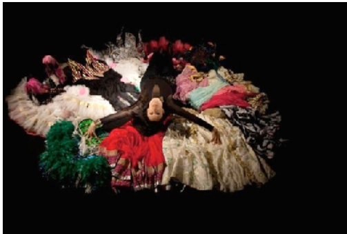
3 - 4