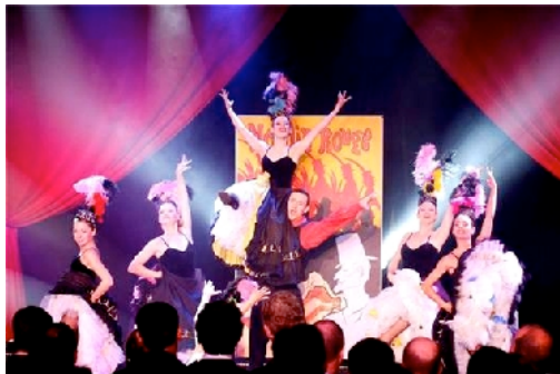
5 - 6